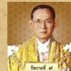
พระบาทสมเด็จพระปรมินทรมหาภูมิพลอดุลยเดช (พ.ศ.2489-2559) King Rama IX (1955-2016)

พ.ศ. 2494 จัดตั้งโรงเรียนแพทย์แผนโบราณแห่งประเทศไทยที่วัดโพธิ์ ตามพระราชปกราก ร 9 1951 - Traditional Medical School of Thailand was established at Wat Pho in response to His Majesty the King's initiative.