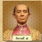
พระบาทสมเด็จพระจอมเกล้าเจ้าอยู่หัว (พ.ศ. 2394-2411) King Rama IV (1804-1868)

ศึกษาตำรายาไทยโบราณที่วัดพระเชตุพนวิมลมังคลาราม 63 รูปและ 100 รูป และมีการพิมพ์เป็นภาษาจีนด้วยถึง 82 เล่ม 82 รูป Muluic descriptors of Wat Pho include 63 human body maps showing massage lines and points and poems for 80 postures of ruesi dadton (self-stretching). 82 ruesi dadton and-tao silhouettes were made for public learning