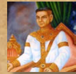
สมเด็จพระบรมไตรโลกนาถ (พ.ศ.1991-2031) King Trailokanat (1448-1488)

สมัยกรุงศรีอยุธยา (พ.ศ. 1993-ปัจจุบัน) The Ayutthaya Period (1350-present)