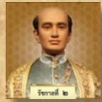
พระบาทสมเด็จพระพุทธเลิศหล้านภาลัย (พ.ศ. 2352-2367) King Rama II (1809-1824)

ศึกษาตำรายาไทยโบราณที่วัดพระเชตุพนวิมลมังคลาราม 63 รูปและ 100 รูป และมีการพิมพ์เป็นภาษาจีนด้วยถึง 82 เล่ม 82 รูป Muluic descriptors of Wat Pho include 63 human body maps showing massage lines and points and poems for 80 postures of ruesi dadton (self-stretching). 82 ruesi dadton and-tao silhouettes were made for public learning