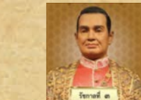
พระบาทสมเด็จพระนั่งเกล้าเจ้าอยู่หัว (พ.ศ. 2367-2394) King Rama III (1824-1851)

ปฏิสังขรณ์วัดโพธาราม หรือวัดโพธิ์ Renovation of Wat Phocharam (or Wat Pho) รวบรวมตำรายาและรูปปั้นการยืดตัว Compilation of medicine treatises and ruesi dadton (self-stretching) sculptures