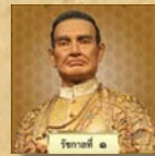
พระบาทสมเด็จพระพุทธยอดฟ้าจุฬาโลก (พ.ศ. 2325-2352) King Rama I (1782-1811)

จดหมายเหตุลาลูแบร์ กล่าวถึงหมอนวดว่า "ชอบขยี้กันไปทั่วตัว เมื่อใครป่วยไข้ในกรุงสยาม บางทีก็ขึ้นเดินเอาเท้าเหยียบบนกายคนไข้" Monsieur De La Loubere, Ambassador of France to Siam during the reign of King Narai, wrote about masseurs that "They like to massage all over the body. Whenever someone is sick in Siam, the masseur will step or tread on the patient's body."