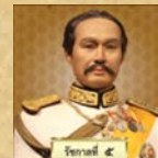
พระบาทสมเด็จพระจุลจอมเกล้าเจ้าอยู่หัว (พ.ศ. 2411-2453) King Rama V (1868-1910)

หลักฐานทางเอกสารบันทึกชื่อของข้าราชการในกรมหมอนวดอยู่ในข้าราชการฝ่ายวังหน้าที่เกี่ยวข้องกับการแพทย์ Document recorded the names of officials in the Massage Therapy Department (Krom Moh Nuad) under the Front Palace officials dealing with medical services.